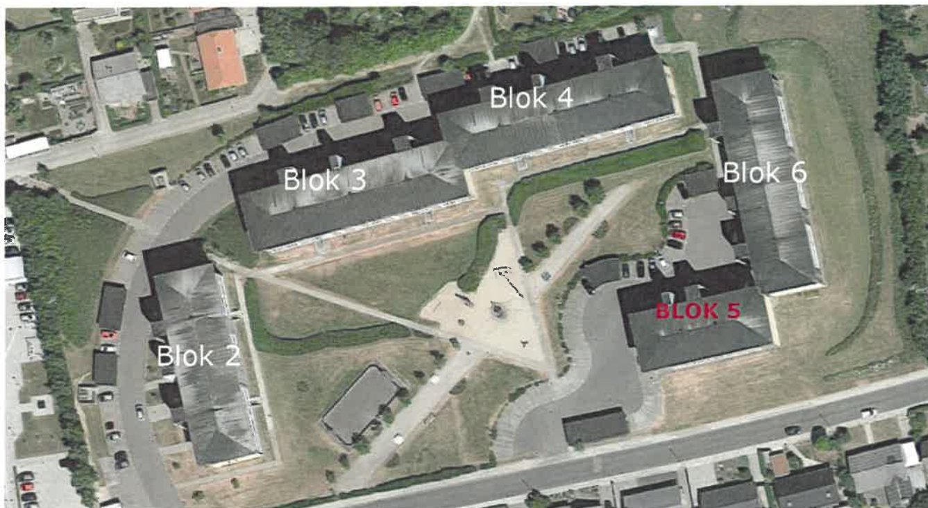
Bloknumre, vi er startet med Blok 2, rækkefølge er blok 2, 3, 4 og 6

Her i starten har vi afsat ekstra tid af til blok 2 til at gøre os erfaringer og se om der dukker noget uforudset op der skal løses. Disse erfaringer er nødvendige for at kunne opnå en optimal byggerytme, så vi kan optimere den resterende tidsplan, og blive præcise på varslingerne.