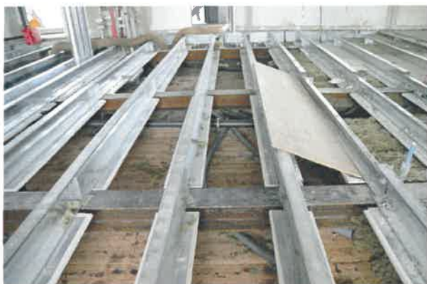
Fra nedbrydning af gulv på 3 sal

Samtidig vil vi takke for jeres forståelse for de gener renoveringen uundgåeligt påfører jer.